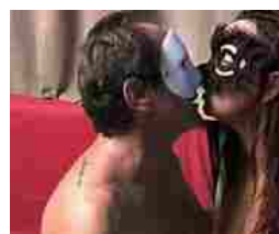
Tre coppie pratesi star del film a luci rosse