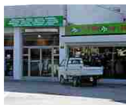
Inaugura e chiude in 12 giorni il mega bazar cinese