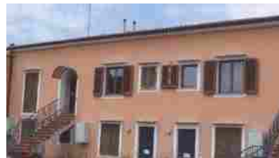
Appartamenti Monsummano Terme Via Cesare Battisti - 73000 €

Vendite giudiziarie - Il Tirreno Tribunale di Livorno Tribunale di Pisa Tribunale di Lucca Tribunale di Massa