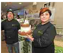
«Una piazza morta», e la pasticceria chiude