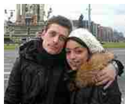
Muore a 27 anni uccisa da un tumore