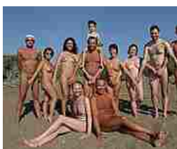
Nudisti cercansi per il film di Ruffini