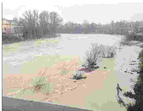
► a pagina 9

no di conseguenza esigue, sporadiche e drammaticamente insufficienti" sottolinea Bastioni. In tutto questo, va anche ribadito l'importanza della comunicazione ai cittadini. "I piani di protezione civile non possono essere più considerati come delle mere incombenze amministrative. Occorre dare la giusta informazione verso l'esterno, divulgare la consapevolezza nella popolazione dei rischi che incombono sul territorio e in che modo farvi fronte. Su questo argomento - conclude Crescenzo Bastioni del Cer di Rieti -, vorremmo un salto di qualità deciso, rispetto al poco o nulla sin qui prodotto dall'amministrazione comunale, che per Legge ha un obbligo di informazione verso i cittadini. Un piano di protezione civile, seppur ben fatto, qualora non conosciuto dalla popolazione, diventa uno strumento di scarsa utilità". ◀