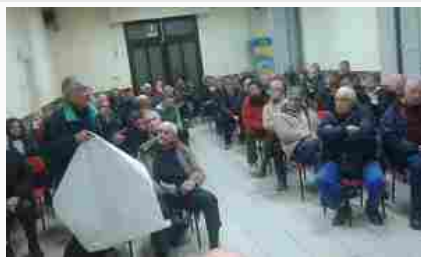
L'assemblea delle acque alla Ferruccia

A fine febbraio pronta la terza cassa di espansione a Quarrata. Sindaco, amministratori, comitati e cittadini della Piana attendono notizie dai Laghi Primavera