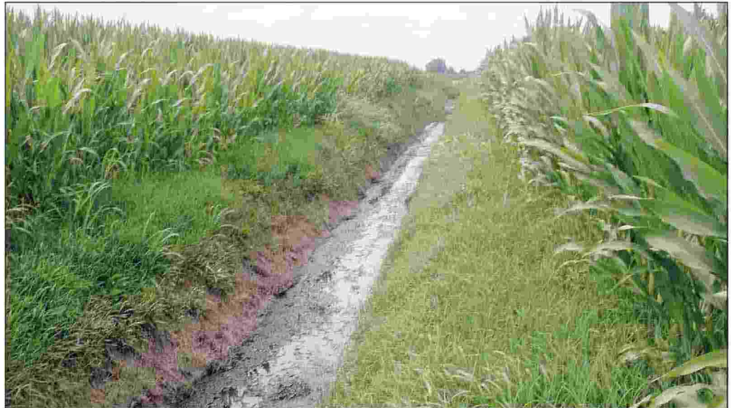
Un'immagine dello scolo che porta al depuratore di Arquà Polesine

"Per la realizzazione di questo piano straordinario - spiega Conte - la normativa ha istituito un apposito fondo con una dotazione di 10 milioni di euro per l'esercizio 2014, 30 milioni di euro per l'esercizio 2015 e di 50 milioni di euro per l'esercizio 2016, finalizzato prioritariamente a potenziare la capacità di depura-