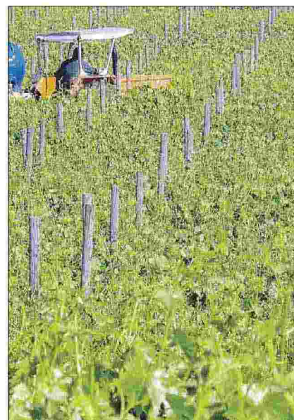
Fiume Clitunno In una prima fase sarà la fonte di approvvigionamento idrico

un quadro per l'azione comunitaria in materia di acque, finalizzata principalmente al miglioramento dello stato delle acque per assicurare un utilizzo sostenibile basato sulla protezione a lungo termine delle risorse idriche disponibili. I lavori prevedono, infatti, un ammodernamento del sistema di monitoraggio installato immediata-