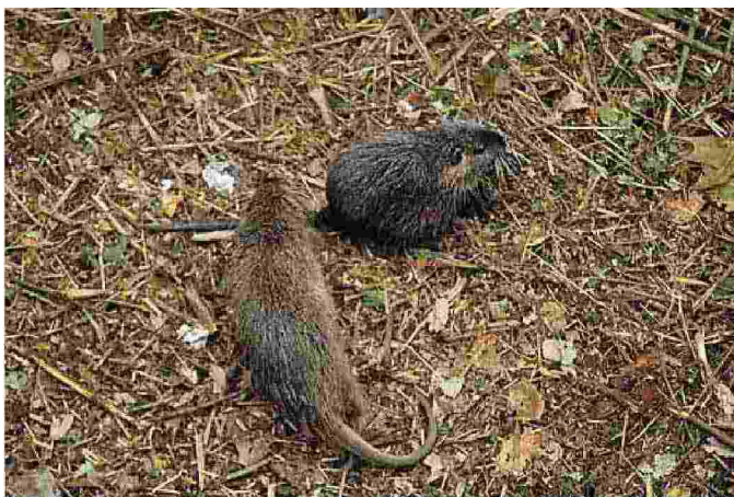
Allarme-nutrie: servono un piano ed i fondi per l'eradicamento