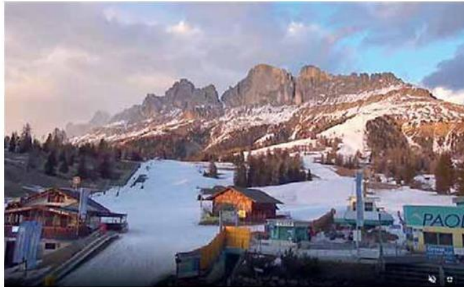
• Carezza: sulle piste da sci c'è neve, artificiale. In alto quasi nulla

Secondo l'Osservatorio permanente sugli utilizzi idrici per il distretto delle Alpi Orientali, riunitosi a Trento con una settimana d'anticipo a causa della situazione, fa sapere l'Anbi, i