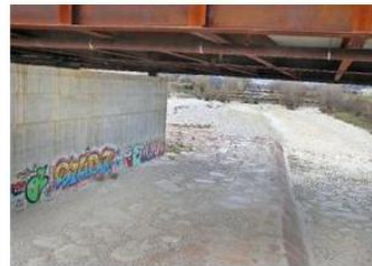
Quel che resta del torrente Astico senza pioggia e neve