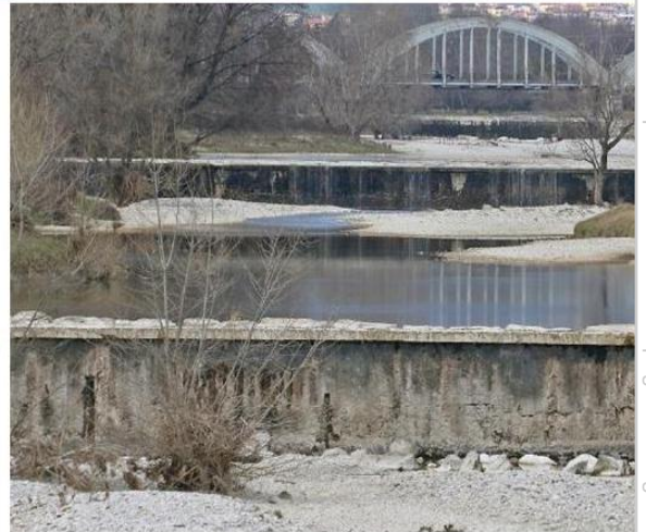
Il torrente Astico ai minimi termini dopo un inverno arido.