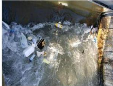
Flaconi e bottiglie vuoti in acqua

«Abbiamo provveduto - ha sottolineato il sindaco Morena Martini - a installare sistemi di rilevazione in alcune zone che ovviamente non rendono pubbliche e faremo in modo di monitorare in modo più attento e vigile il territorio. Inaspriremo anche le multe. Ne abbiamo già com-