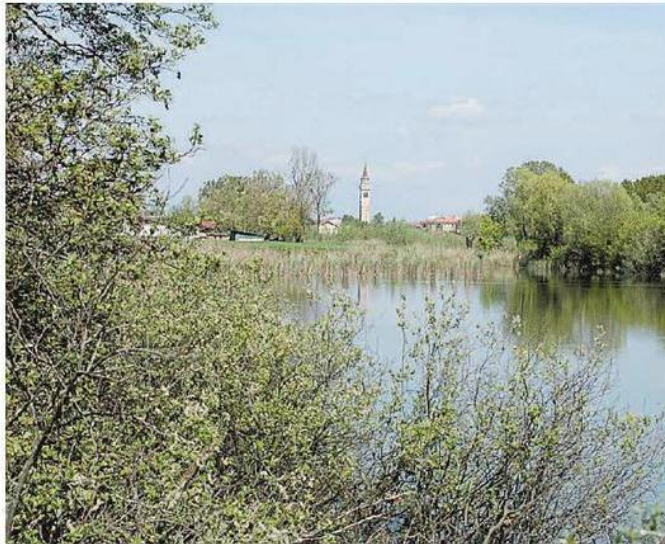
Le ex cave Cavasin, l'oasi Wwf di via Ongari a Noale