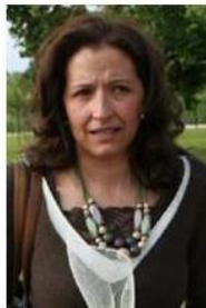
Il sindaco Morena Martini

minate diverse, visto che i nostri addetti sono riusciti a risalire a persone che avevano abbandonato rifiuti aprendo i sacchi e individuando i loro indirizzi. Le sanzioni in vigore sono però irrisorie, quindi con una delibera le aumenteremo. Certo è - ha aggiunto il primo cittadino - che è necessario puntare in primo luogo sull'educazione dei cittadini. Non capisco inoltre il senso di questi comportamenti: la tassa sui rifiuti viene pagata anche da coloro che li disperdono nel territorio. Questa è bieca inciviltà». •