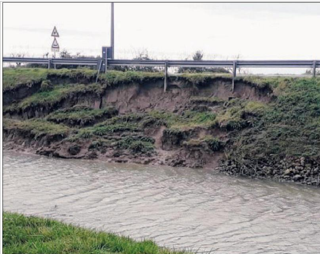
La frana ad una sponda del Poazzo, a dicembre a Polesella

La proprietà intellettuale è riconducibile alla fonte specificata in testa alla pagina. Il ritaglio stampa è da intendersi per uso privato