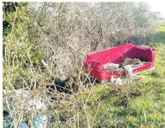
ADRIA Il divano abbandonato nel boschetto Liparo