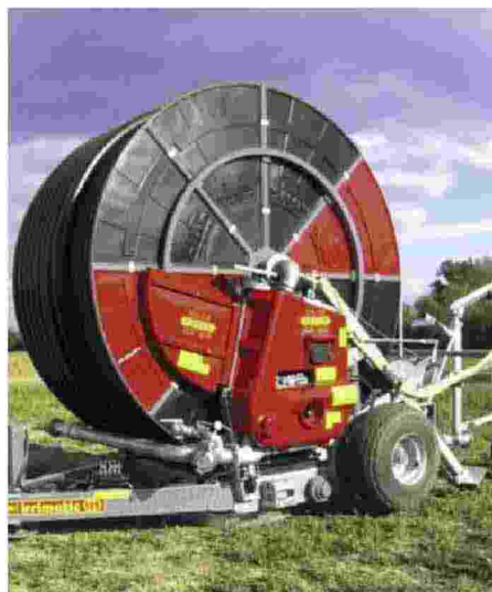
Sopra, il castello di Malpaga in mezzo alla campagna dell'omonima azienda agricola. Sopra, un «rotolone»