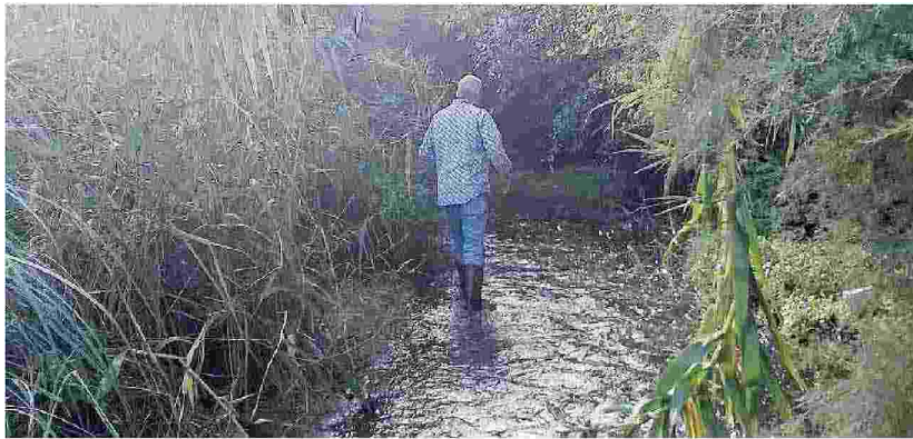
Il torrente Grammisato il corso d'acqua è ristretto in una folta vegetazione

I residenti di Vallate e Piromalena chiedono interventi