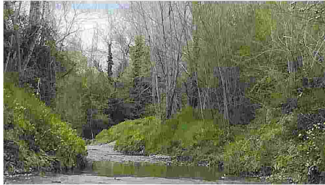
Torrente Bozzone Rimosse due piante di pioppi che stavano per cadere