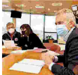
Vorremmo capire quali sono gli investimenti previsti dal governo per la Calabria per rilanciare definitivamente questa martoriata terra Cgil, Cisl e Uil