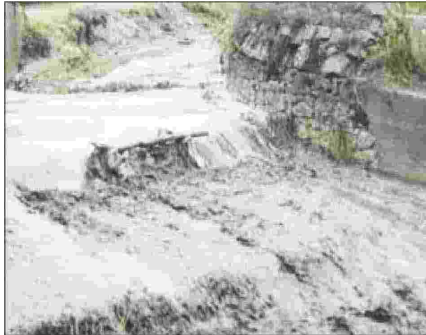
Un tratto del Solofrana