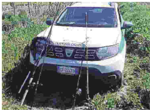
Il materiale recuperato

Dopo la riqualificazione dell'area grazie al progetto LIFE Zone Umide Sipontine, l'Oasi Laguna del Re sta diventando sempre più un punto di riferimento per la conservazione