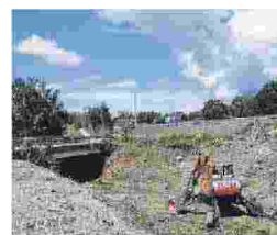
Mezzi in azione a Cassino, Cervaro, Piedimonte, Atina e Sant'Apollinare