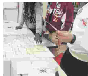
Gli studenti durante il progetto

bonifica in Romagna. Alla chiusura dell’Escape room c’è stato un confronto e scambio reciproco dove sono stati analizzati i contenuti didattici del gioco. Il progetto prevede un’attività di tutoraggio per supportare studenti e insegnanti nella partecipazione al Concorso regionale a premi, “Acqua e Territorio”.