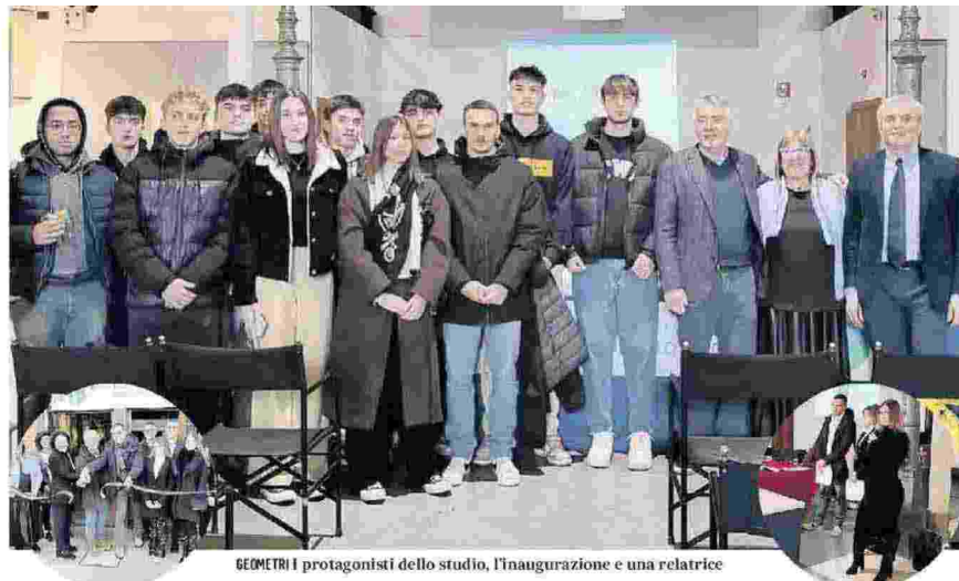
GEOMETRI I protagonisti dello studio, l'inaugurazione e una relatrice