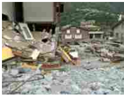
Regione Lombardia: 843mila euro per il maltempo del 2021 e 2022 DICEMBRE 16, 2024