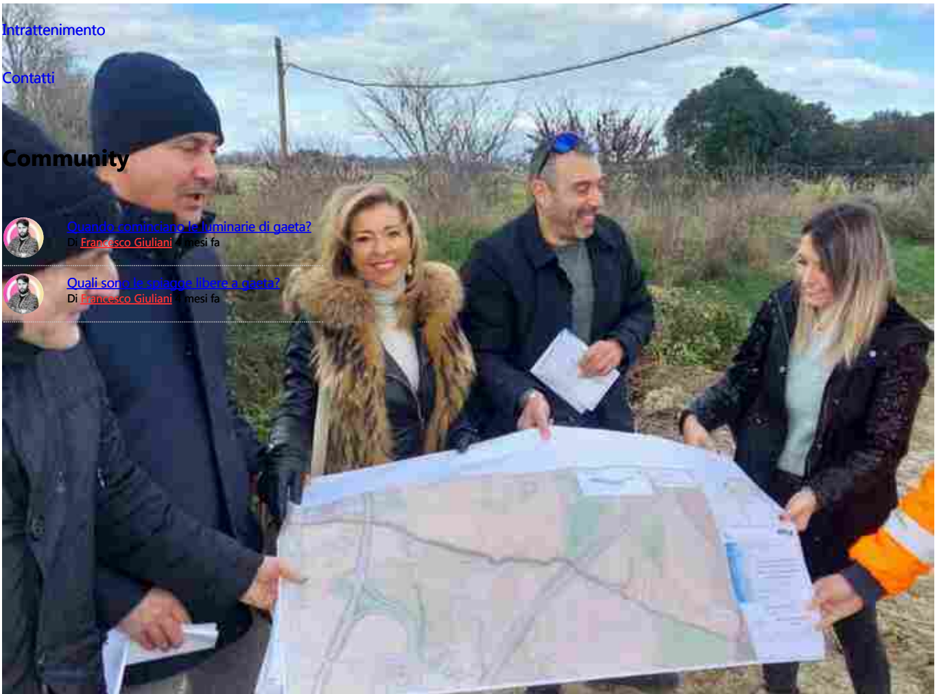
Falconara: partono i lavori di messa in sicurezza per i fossi San Sebastiano, Cannetacci e Liscia - Gaeta.it

Ritaglio stampa ad uso esclusivo del destinatario, non riproducibile.