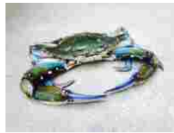
Pesca: 100 milioni di danni a causa del granchio blu LUGLIO 2, 2024