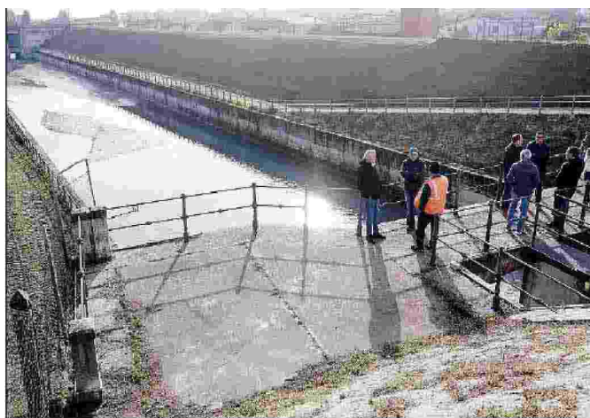
Un manufatto del consorzio di bonifica Adige Po

L'assemblea dei sindaci ha l'unico scopo di eleggere i tre membri che entreranno a far parte dell'assemblea consortile, mentre la consulta dei sindaci svolge funzioni consultive e propositive di supporto all'attività del consiglio di amministrazione dell'ente (cda), al fine di conciliare le esigenze del territorio con l'amministrazione e la gestione del consorzio. Viene convocata almeno due volte all'anno ed esprime parere obbligatorio e non vincolante al cda sul piano annuale di attività,