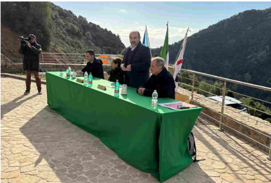
La presentazione del progetto

Assegnato l'incarico per la realizzazione, un investimento da 163 milioni di euro