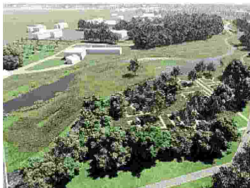
Come sarà Due rendering del futuro parco fluviale del Marzenego