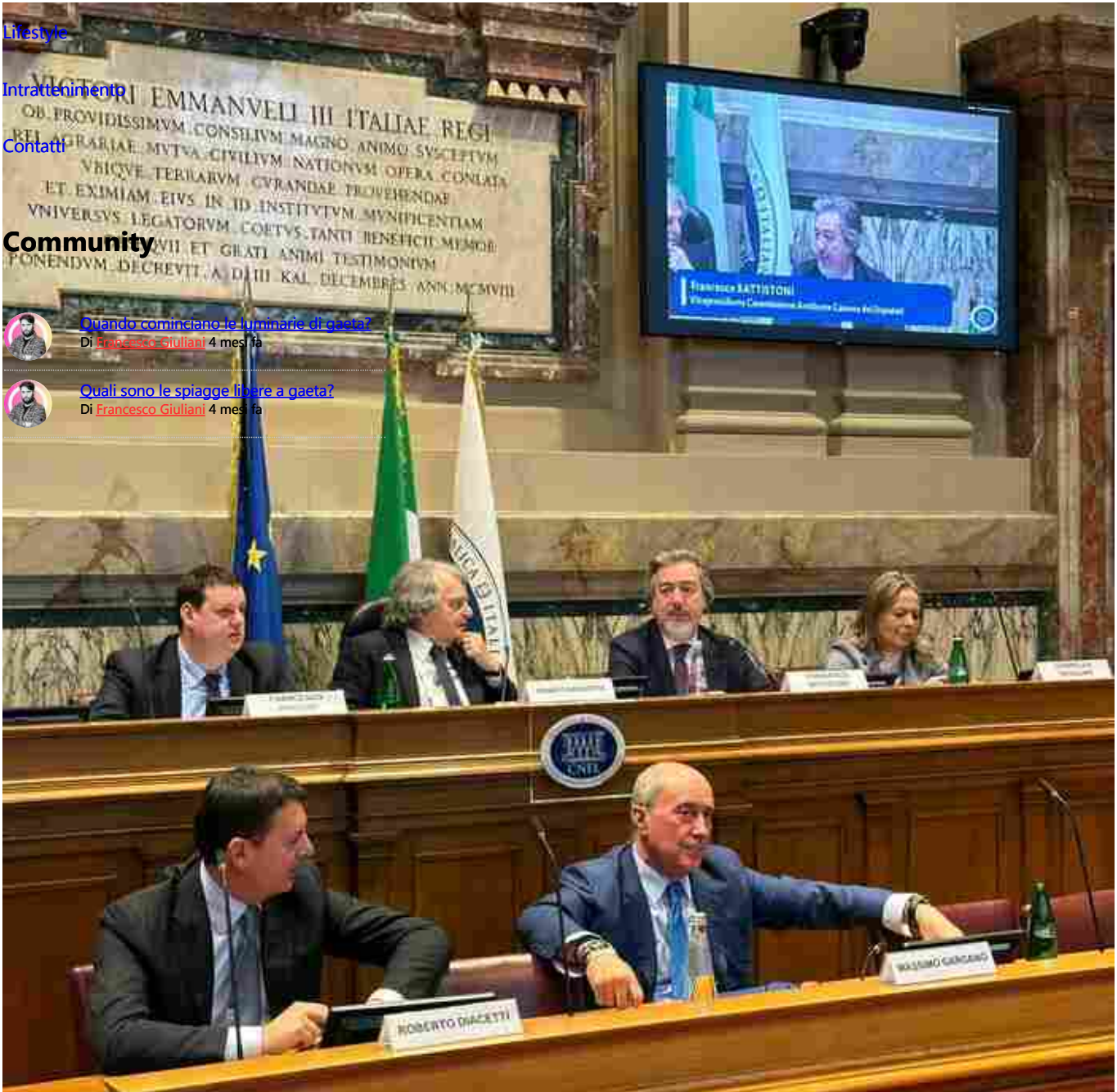
Nuovo accordo tra Anbi e Cnel: il futuro dell'economia dell'acqua in Italia - Gaeta.it

Quali sono le spiagge libere a Gaeta? Di Francesco Giuliani 4 mesi fa