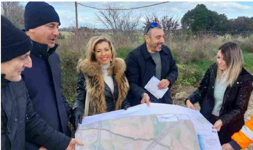
Sopralluogo lungo l'argine del canale della Liscia a Falconara

FALCONARA – Al via i cantieri per completare la messa in sicurezza dei fossi San Sebastiano, Cannetacci e Liscia . Il Consorzio di Bonifica delle Marche ha infatti assegnato i lavori alla società Ridolfi di Pesaro e nella mattinata di ieri, martedì 14 gennaio, si è svolto un sopralluogo lungo l'argine del canale della Liscia, dove entro fine mese partirà la pulizia propedeutica all'intervento strutturale.