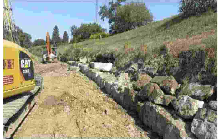
La sicurezza di fiumi e torrenti è senza dubbio una delle più importanti priorità e per questo gli investimenti del Consorzio di Bonifica sono di alto livello

que anni 1,8 milioni di euro. Per lo Staggia, gli interventi del Consorzio di Bonifica Medio Valdarno a Poggibonsi; il ripristino in sponda sinistra nel tratto dietro la scuola media Leonardo Da Vinci per un conto economico complessivo di circa 60mila euro e l'allungamento di una palizzata in legname per bloccare l'estendersi dei fenomeni di erosione nel tratto dietro la zona artigianale di Bellavista per altri 30mila euro. In adiacenza alla pista ciclabile Poggibonsi-Staggia, inoltre, la realizzazione di una grata in legname detta 'grata viva' che sarà fondamentale per far tornare rigogliosa la vegetazione. Sull'Elsa invece la riqualificazione di sponda nella zona degli impianti Virtus, la si-