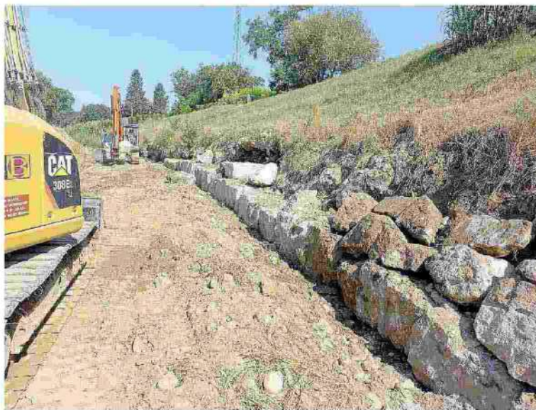
I lavori Ruspe in azione in prossimità dei fiumi Staggia e Elsa per rafforzare la sicurezza idraulica attraverso la manutenzione ordinaria

"Opere di ripristino importanti, indicative di un serio impegno"