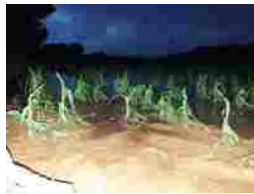
Coldiretti: “Dopo il maltempo si contano i danni” SETTEMBRE 9, 2024