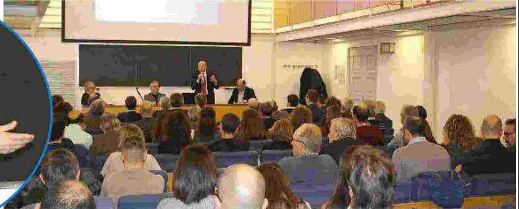
URBINO Il convegno organizzato dal Consorzio di Bonifica che ha presentato uno studio sullo stato dei fiumi