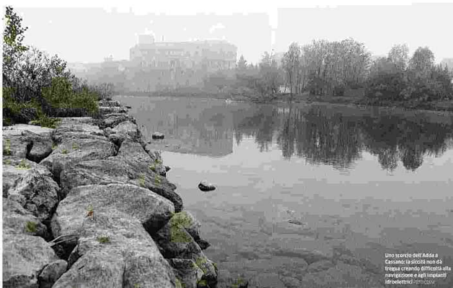
Uno scorcio dell'Adda a Cassano: la siccità non dà tregua creando difficoltà alla navigazione e agli impianti idroelettrici. PIRELLA

In affanno anche il Brembo: ora favorito dalla manutenzione del canale Masnada