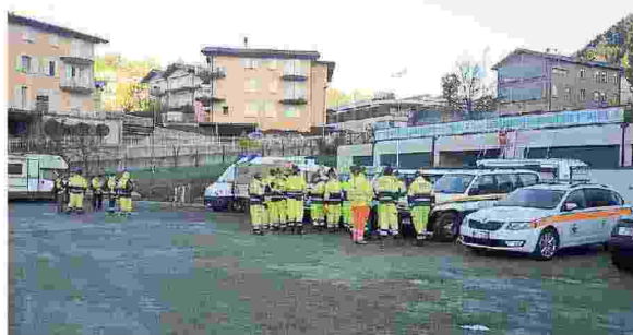
Alcuni degli automezzi coinvolti nella simulazione messa in atto ieri mattina a Castelnovo Monti