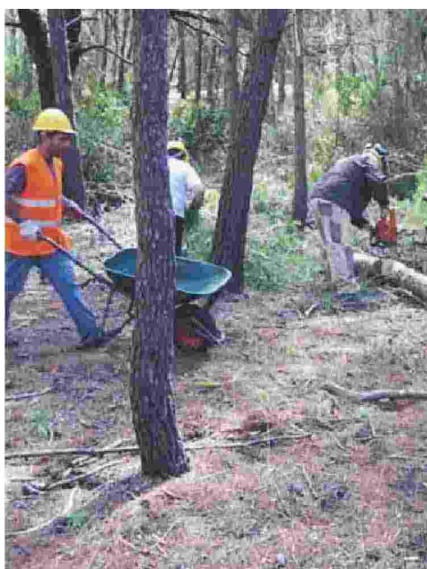
MANUTENZIONE DEL VERDE Operai forestali al lavoro per tenere in buono stato le tante aree boscate lucane

A conti fatti, Braia non ha mancato di sottolineare: «Manteniamo l'impegno assunto di garantire il completamento delle giornate lavorative previste a tutte le platee degli addetti forestali». Va ricordato che nella riunione della Giunta regionale del 3 novembre scorso, sono state approvate le delibere per il trasferimento ai Consorzi di Bonifica di 2.3 milioni di euro sul progetto Vie Blu, secondo stralcio, e circa 283mila euro alle aree programma Marmo Platano-Melandro e Metapontino-Collina Materana per la «continuità delle attività relative agli operai cosiddetti centocinquantunisti». Sullo sfondo, infine, l'impegno a «proseguire e condividere la proposta di nuova governance della forestazione a partire dall'annualità 2018».