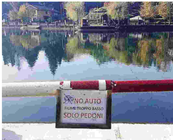
L'avviso comparso a Villa d'Adda: sullo sfondo il traghetto