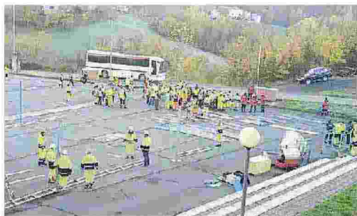
L'allestimento del campo base a Castelnovo Monti