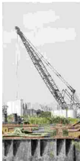
LA NOVITÀ Al via i cantieri per automatizzare le paratoie

I PRIMI CITTADINI DEI DUE COMUNI INTERESSATI: «LA RETE DEI CANALI È QUELLA DELLA SERENISSIMA E BISOGNA RINNOVARLA»