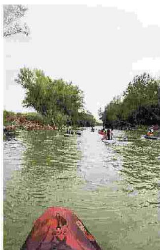
Un tratto dell'Ombrone

Il progetto è proposto dall'Università di Firenze con l'adesione di Buonconvento e Cinigiano, Anci, Cif (centro italiano per la riqualificazione fluviale), associazione Terramare e altre associazioni. È un progetto di dimensioni sovralocali, quelle del bacino idrografico, e con un'ottica istituzionale multilivello.