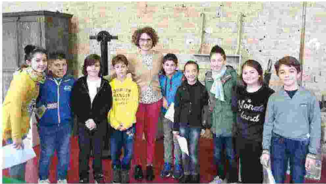
L'iniziativa fa parte del laboratorio per gli studenti dei master di sviluppo locale e sviluppo territoriale sostenibile dell'Università di Padova. L'evento si è svolto nell'idrovora di Ca' Vendramin