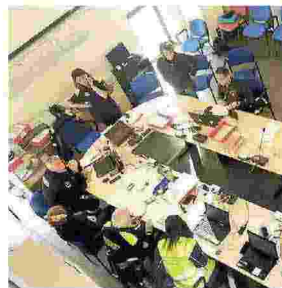
Alcune immagini dell'esercitazione antisismica avvenuta ieri mattina a Castelnovo Monti e in altri Comuni