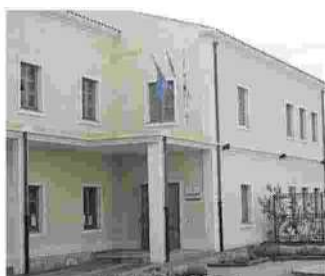
Il municipio di Nurachi