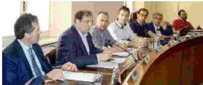
INCONTRO Illustrate le attività del Consorzio di Bonifica.