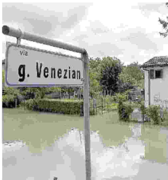
TORRE Via Venezian al primo acquazzone finisce sott'acqua. Ora con il nuovo bacino non si verificheranno più gli allagamenti