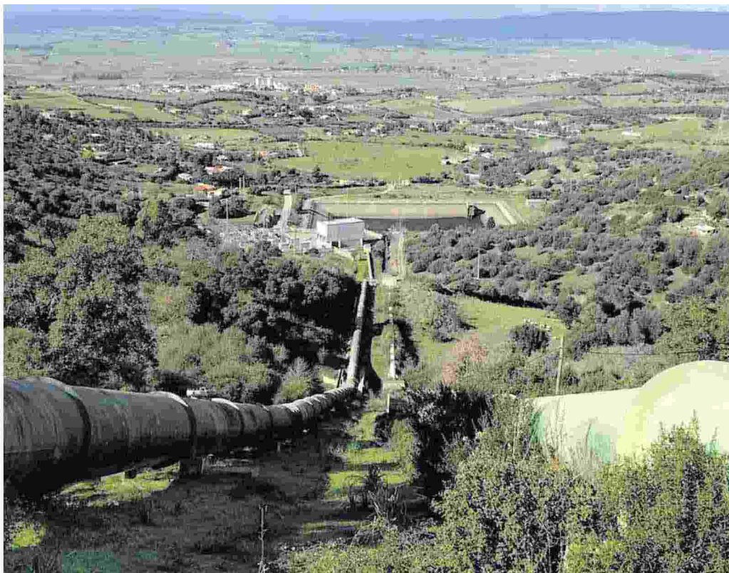
Alcune infrastrutture del Consorzio di Bonifica nella Piana di Chilivani