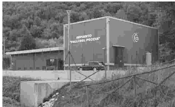
Il Consorzio Aurunco di bonifica

fino allo scorso 31 dicembre. Il Consorzio Aurunco, in un'apposita relazione, ha sottolineato la necessità di ulteriori interventi in zona, chiedendo l'affidamento al consorzio di Napoli e Volla. La Regione ha quindi accolto la richiesta così da garantire la continuità dell'azione di bonifica ed irrigazione sul territorio, con l'obiettivo di evitare danni all'agricoltura e alle persone. Qualche giorno fa era emerso il grave problema del mancato sti-