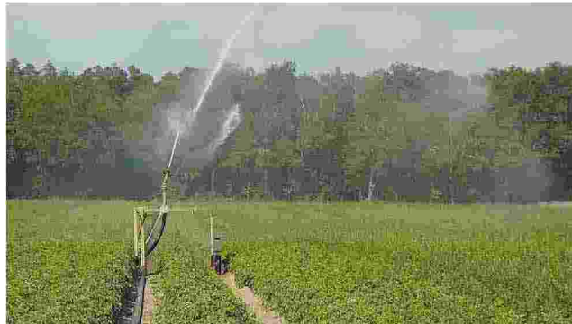
Fondi regionali per contrastare la desertificazione del territorio