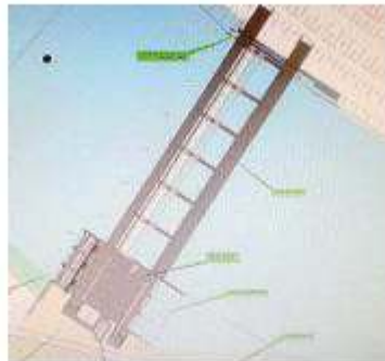
Il progetto della mega diga

Diga sull'Adige, dopo i primi Comuni ora si allarmano anche i consorzi. La realizzazione di una mega diga sul fiume Adige – ai confini tra Padova, Verona e Rovigo – sarà oggi al centro di una discussione nel corso dell'assemblea del Consorzio Leb, ente consortile di secondo grado che comprende i rappresentanti dei consorzi di bonifica Adige Euganeo di Este, Alta Pianura Veneta di San Bonifacio e Bacchiglione di Padova. Il progetto è arrivato a conoscenza delle istituzioni locali solo lo scorso weekend. La diga sull'Adige – opera da oltre 42 milioni di euro proposta dalla Lagarina Hydro di Limena – attraverserebbe l'intera sezione del fiume all'altezza della località Rosta, tra Badia Polesine e Terrazzo e a poche centinaia di metri da Castelbaldo. Grazie a un salto di 5 metri, la diga garantirà la produzione di energia idroelettrica. Dopo i timori avanzati dal sindaco di Barbona e