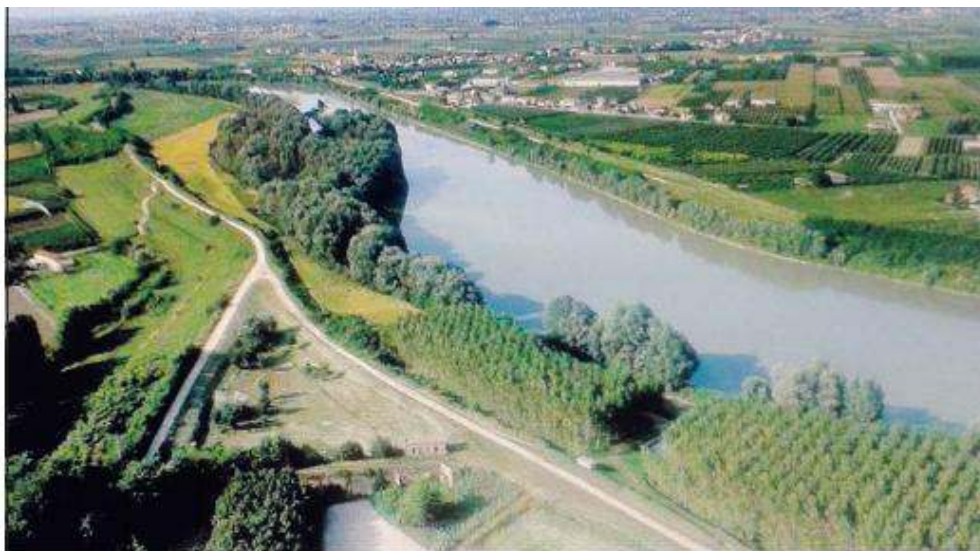
La diga sarà costruita lungo il corso dell'Adige