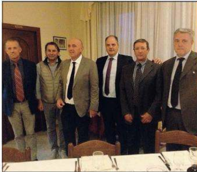
L'incontro con l'onorevole Castiglione

“Governiamo una realtà in perenne rischio per via del difficile deflusso delle acque - così Visentin - e la salvaguardia di questa fetta del Paese ricade sulle nostre spalle con tutte le responsabilità e i costi del caso. C'è amarezza, non lo nascondo, per non veder inseriti fondi per la subsidenza nel bilancio regionale 2015 e ci attendiamo ed auspichiamo anzi che il governo possa intervenire per aiutarci a far fronte a questa necessità così