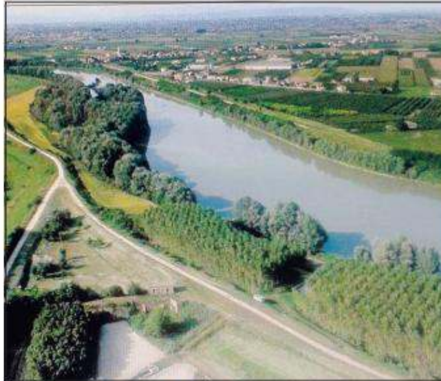
L'area interessata dalla diga sull'Adige

Si tratta di uno sbarramento che attraversa l'intera sezione del fiume Adige per provocare un salto d'acqua di oltre 5 metri. L'opera, prevista in località Rosta di Badia Polesine, comprensiva di paratoie, centrale idroelettrica ed edifici annessi, prevede un costo netto di 42,5 milioni di euro. La diga congiungerà Badia