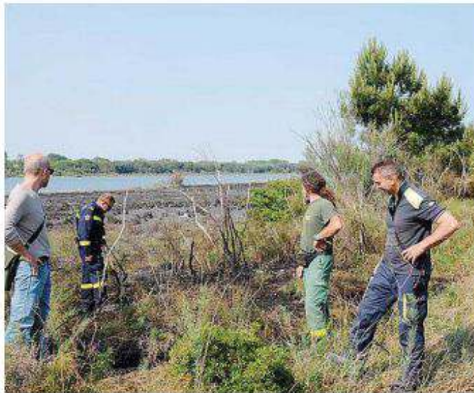
Vigili del fuoco e volontari nella zona interessata dal rogo

Il danno ambientale è molto grave e va a colpire un'area oltretutto protetta dove flora e fauna crescono da secoli. Non sono state coinvolte persone. L'allarme è stato lanciato da un dipendente della Eraclea Patrimonio, gestore del parcheggio, e poi da alcuni bagnanti sul posto, noto anche come oasi naturalista oltre che naturalista di estremo pregio. Sul posto sono giunti immediatamente i vigili del fuoco di San Donà con la polizia locale di Eraclea assieme al sindaco, Giorgio Talon. Purtroppo c'è voluto tempo perché sopraggiungessero gli