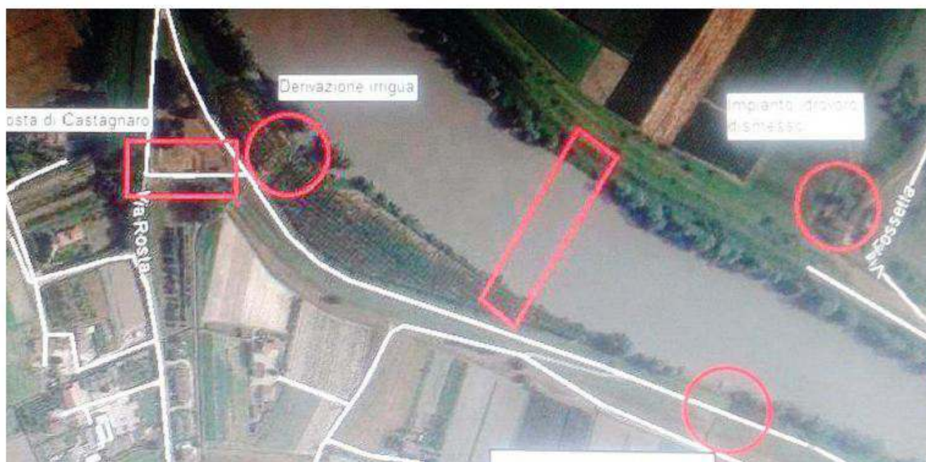
Al centro, in rosso, viene indicato il punto in cui il manufatto idraulico attraverserà il fiume Adige