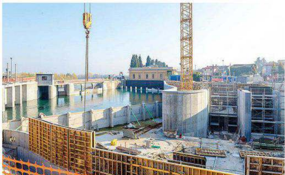
Il cantiere della centrale idroelettrica del consorzio di bonifica Piave a Nervesa