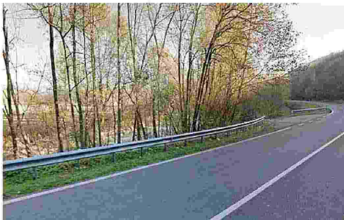
La strada che conduce a Cimano e che costeggia il Ledra