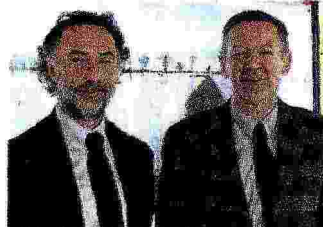
Consorzio Berselli e Spinazzi.