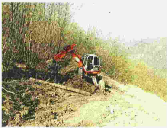
Foto di archivio di intervento del Consorzio di Bonifica contro il dissesto idrogeologico