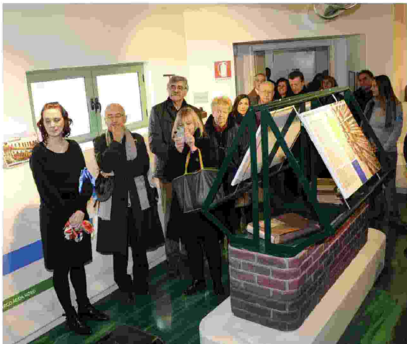
Un'immagine delle sale inaugurate ieri mattina nel museo di via Corio