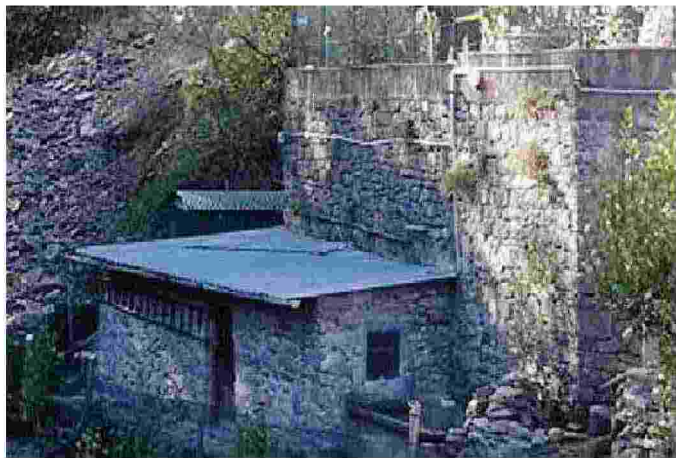
La frana sull'argine del Torbida, vicino a un'abitazione evacuata

Quindi se tutto dovesse procedere secondo la tabella di marcia, la famiglia evacuata già dalla prossima settimana potrebbe tornare a vivere nella sua casa. (c.b.)