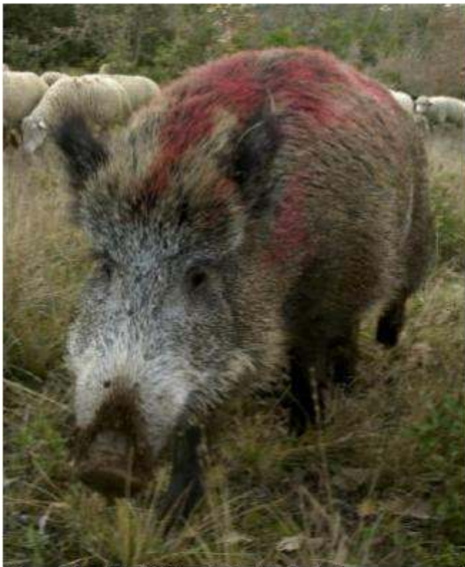
Un esemplare di cinghiale temuto dagli agricoltori.

lo di un corso d'acqua importante, ci sono conseguenti allagamenti e pericolo per la pubblica incolumità».