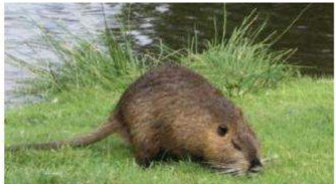
Le nutrie scavano pericolosi cunicoli sotto gli argini dei fiumi.

roso e quindi non attuabile soprattutto oggi che a livello regionale non ci sono fondi disponibili. Restano le trappole oppure la caccia, ma questa seconda soluzione non è praticabile in prossimità dei luoghi abitati e di non facile attuazione anche in aree rurali. Occorrerebbero delle campagne di abbattimento mirate, da effettuare sotto la su-