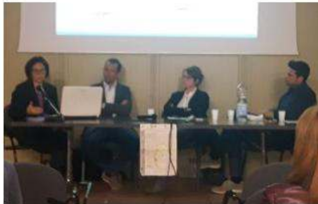
I relatori presenti al convegno sulle fonti alternative. BUSATO

Illustrando le tre fasi previste dal progetto Mosav (Modello strutturale acquedotti veneti) della Regione che persegue una rete di interconnessione idrica per garantire l'approvvigionamento dell'acqua da più fonti e il fabbisogno