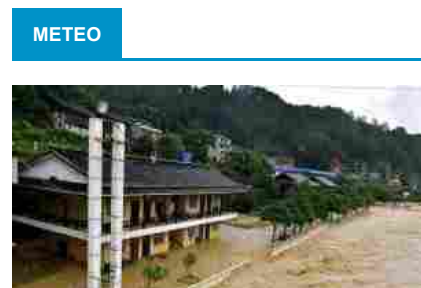
Maltempo in Cina, piogge torrenziali: