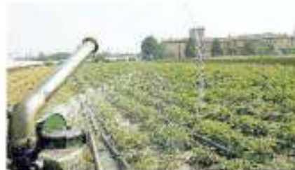
Un impianto di irrigazione: è allarme per la siccità da record

L'Arpav: situazione molto critica, secondo peggior dato degli ultimi 27 anni Poca neve sulle Dolomiti e sulle Prealpi, pochissima pioggia anche a marzo