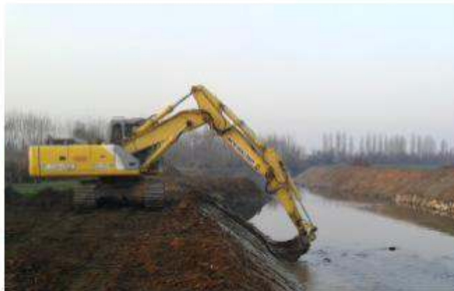
Lavori sull'argine del Tesinella a cura del Consorzio Brenta.