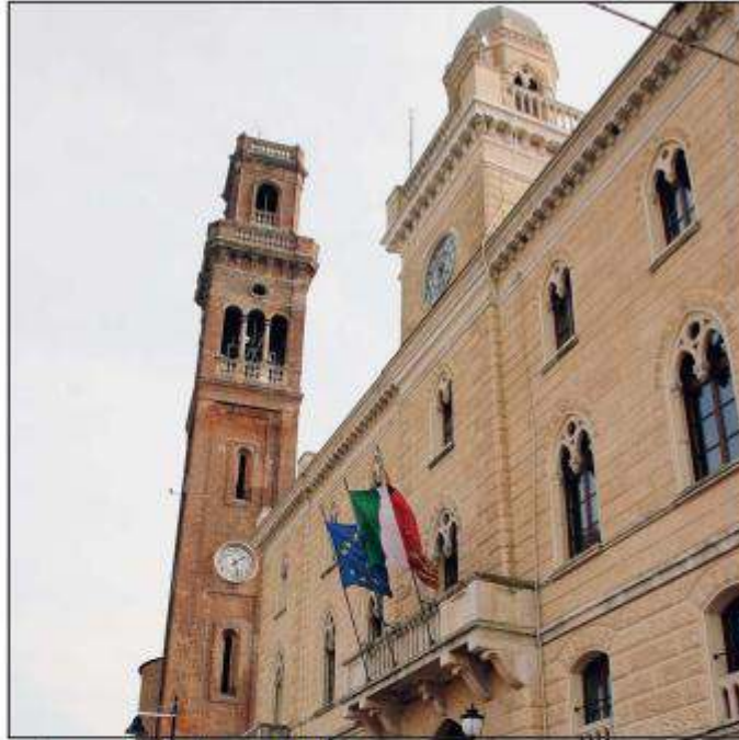
Palazzo Barbiani, municipio di Cavarzere

I consiglieri saranno quindi chiamati a discutere in merito all'affidamento in concessione del servizio di distribuzione del gas naturale, nello