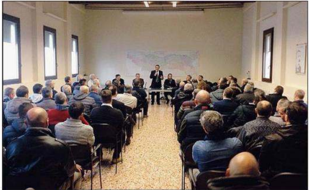
Il momento degli auguri al consorzio di bonifica

"Il sottoscritto - queste le sue parole - così come il territorio hanno bisogno di voi, gli angeli custodi del Polesine. La nostra ambizione, che però coincide anche con il nostro obiettivo, è migliorare se possibile ancor più il servizio nei confronti degli utenti