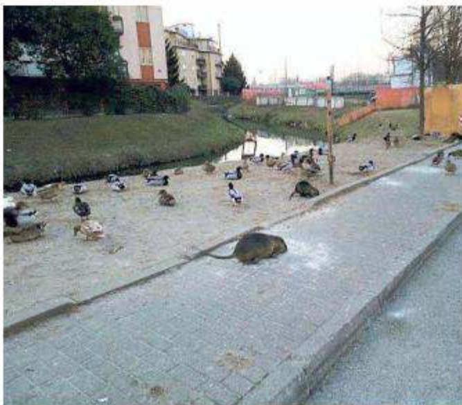
Le nutrie scorrazzano anche in centro a Mestre come in via Olimpia

«La situazione è ormai insostenibile per il proliferare di questo roditore - dice Giulio Rocca -. Le aziende agricole ci inviano richieste pressanti di intervento, per questo motivo devono partire al più presto i corsi per addestrare i cacciatori alla cattura ed all'abbattimento delle nutrie, come previsto dal recente Piano regionale triennale». «La nostra organizzazione è disponibile a collaborare nel modo più utile per la migliore