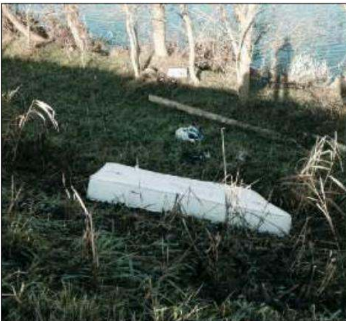
DEGRADO Rifiuti di ogni genere nell'area verde di Cavanella