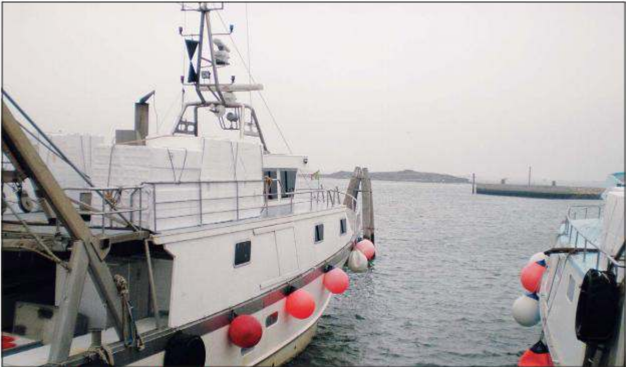
Il porto di Pila: sullo sfondo la bocca a mare

nel bilancio regionale di uno specifico capitolo di spesa pluriennale: la programmazione della manutenzione coprirà un periodo triennale e determinerà, in partenza, l'ottenimento delle procedure autorizzative necessarie per realizzare le opere: "Quasi un'autorizzazione unica, per velocizzare la procedura", commenta Bel-