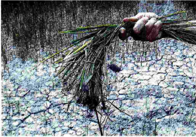
Arsura. La terra spaccata in un terreno della campagna ferrarese