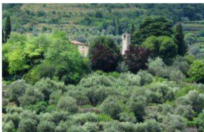
Fumane, terreni privati trasformati in bene pubblico

È pubblicato all'albo pretorio l'avviso con il quale si informa la cittadinanza che è possibile formulare proposte di progetti e iniziative private, funzionali alla redazione del Piano degli Interventi. Le proposte, su modelli recuperabili dal sito del Comune - edilizia privata - dovranno essere consegnate in municipio, ufficio protocollo, il lunedì di martedì e il giovedì al mat-