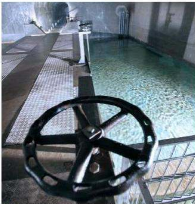
Al Centro idrico di Novoledo si misura il livello della falda