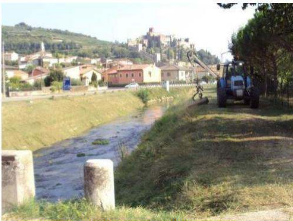
Intervento di manutenzione lungo il Tramigna in prossimità dell'Adige