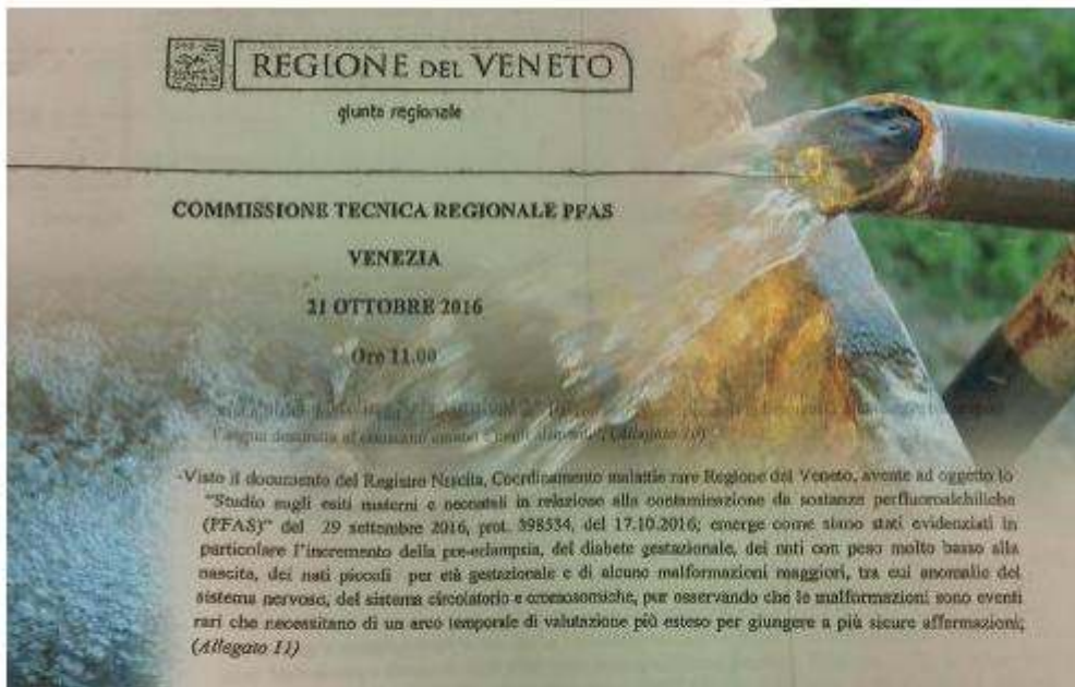
Uno stralcio della relazione redatta dopo l'ultimo incontro della Commissione tecnica regionale Pfas