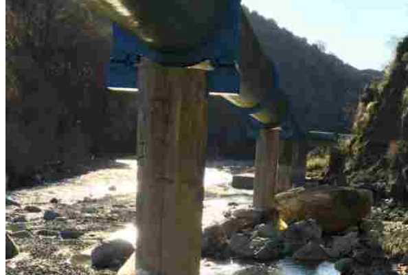
Venerdì 03 Febbraio 2017 - 11:55