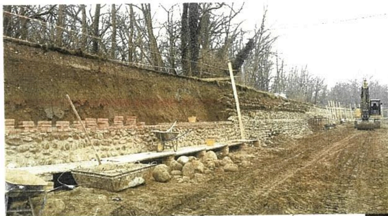
Interventi alle sponde, Naviglio Grande (Bernate Ticino), asciutta primaverile 2017

"I canali, da sempre infrastrutture idrauliche qualificanti per la Lombardia, rappresentano sempre più vere e proprie vie d'acqua attorno alle quali si stanno sviluppando nuove possibilità di utilizzo oltre all'irriguo" commenta il Presidente di ETVilloresi Alessandro Folli. "Proprio per questo assicurare al reticolo le necessarie opere manutentive diventa veramente prioritario" conclude Folli.