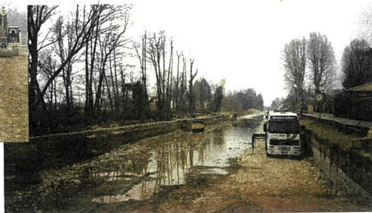
Interventi alle sponde sul Naviglio Grande (Cassinetta di Lugagnano), asciutta primaverile 2017