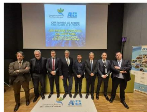
Foto del Convegno Un paese d'acqua. Da gestire.